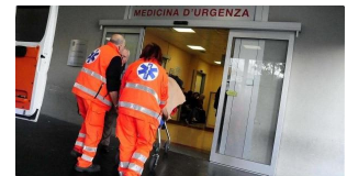
Bimbo di 5 anni cade dal balcone di casa: è grave notizie.it