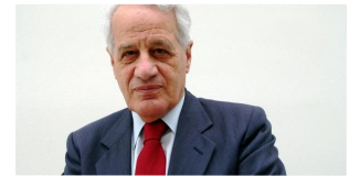
Baldassarre a Zagrebelsky: "Su regioni Conte viola art. 120 Costituzione" Adnkronos