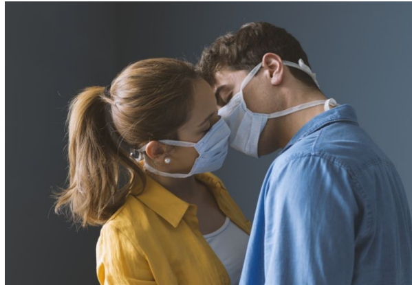
Fase 2, il chiarimento definitivo: chi sono i "congiunti"

Da lunedì 4 maggio, con il primo allentamento delle misure anti-Covid, si potranno incontrare i "congiunti". Si tratta di genitori, figli, nonni, nipoti, fratelli, sorelle, zie e cugini . Probabilmente ci sarà un'estensione anche ai fidanzati, è in forse quella agli amici. A fare chiarezza è una Faq pubblicata sul sito del governo.